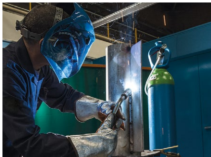
Spawanie MAG stali nierdzewnej

Wydajne rozwiązanie w zakresie gazów osłonowych do spawania MAG stali nierdzewnych