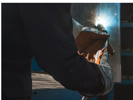
Wszystkie pozycje spawania