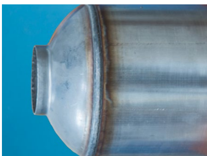
Układ wydechowy z ferrytycznej stali nierdzewnej