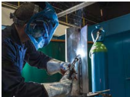
Spawanie MAG stali nierdzewnej

Wydajne rozwiązanie w zakresie gazów osłonowych do spawania MAG stali nierdzewnych