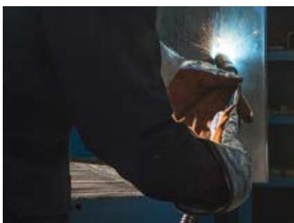
Wszystkie pozycje spawania