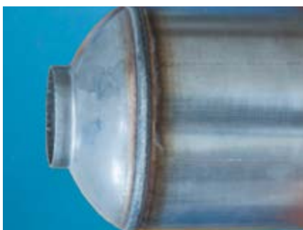
Układ wydechowy z ferrytycznej stali nierdzewnej