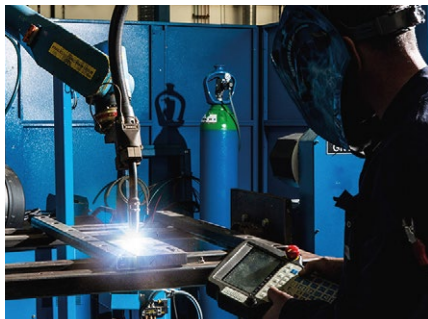
Zrobotyzowane spawanie MAG

Wysokowydajne rozwiązanie w zakresie gazów osłonowych do spawania MAG stali węglowych