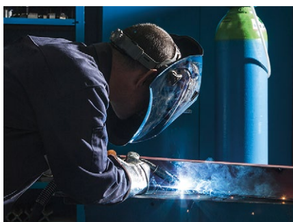
Ręczne spawanie MAG