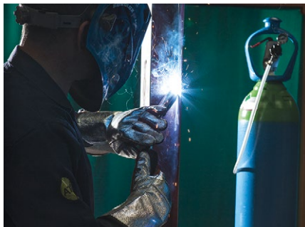
Spawanie MAG stali węglowej

Wysokowydajne rozwiązanie w zakresie gazów osłonowych do spawania MAG ciężkich konstrukcji