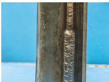
Spawanie wielościegowe – pozycja PF